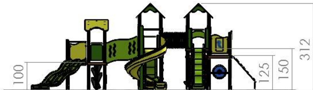
Зона на падане - 68 м 2

2. Габаритни размери на съоръжението и минимално пространство за разполагане